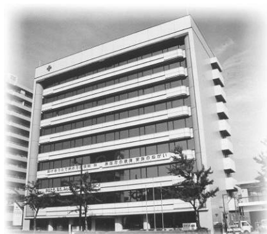
「和歌山県日赤会館」外観